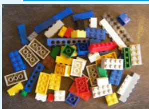
JEU DE LEGO LE DÉFI !

Souvenez-vous des Lègos, des crayons pour colorier le calendrier, d'un cube en carton type Rubik's cube et même des Smarties qui nous ont été distribués à la Matmut !